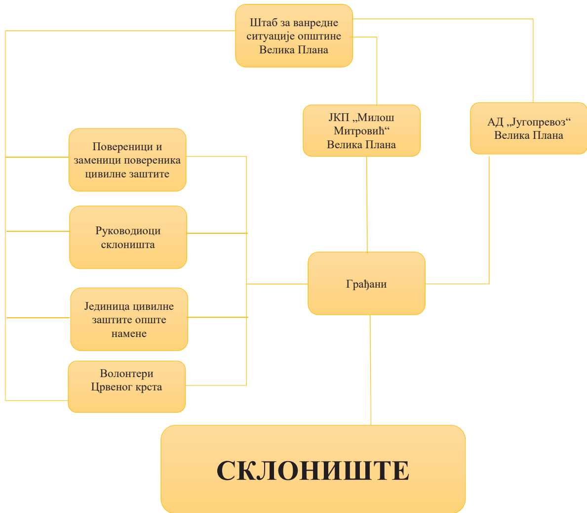
Шема 16 Шематски приказ активирања система за склањање